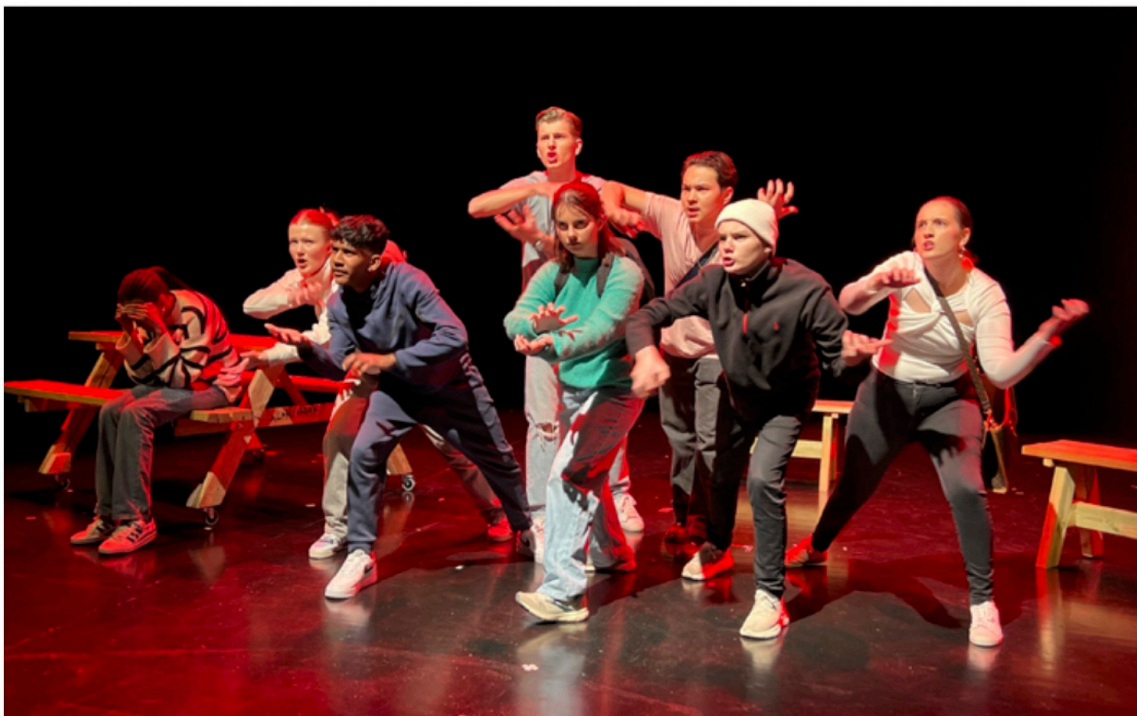
Et imponerende teaterstykke – fra start til slutt. Manu Ung ungdomskompani er støttet av Sparebankstiftelsen DNB.