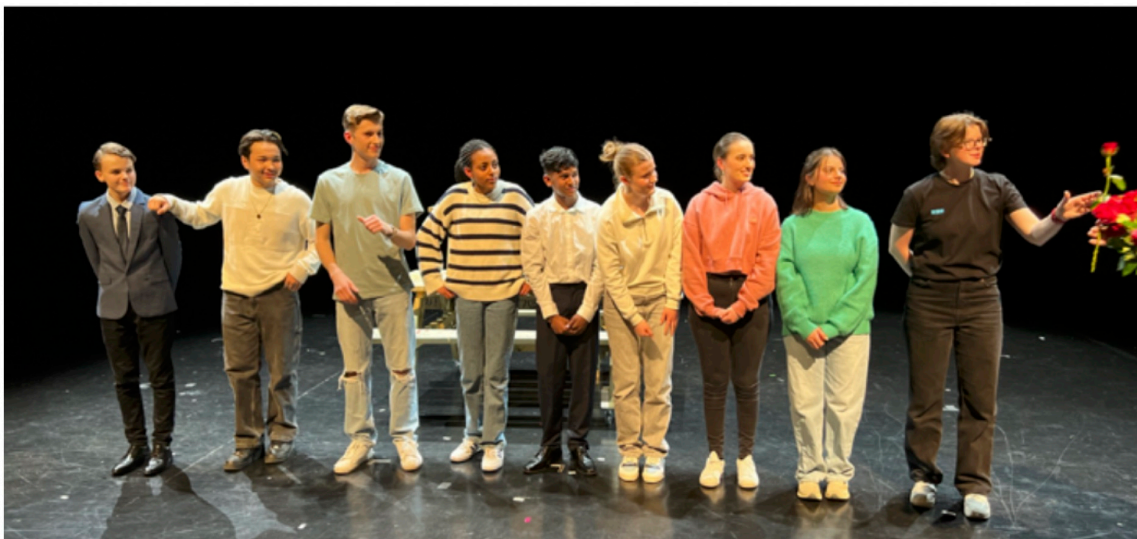
Skuespillere tar i mot blomster etter endt forestilling på Det Norske Teatret.